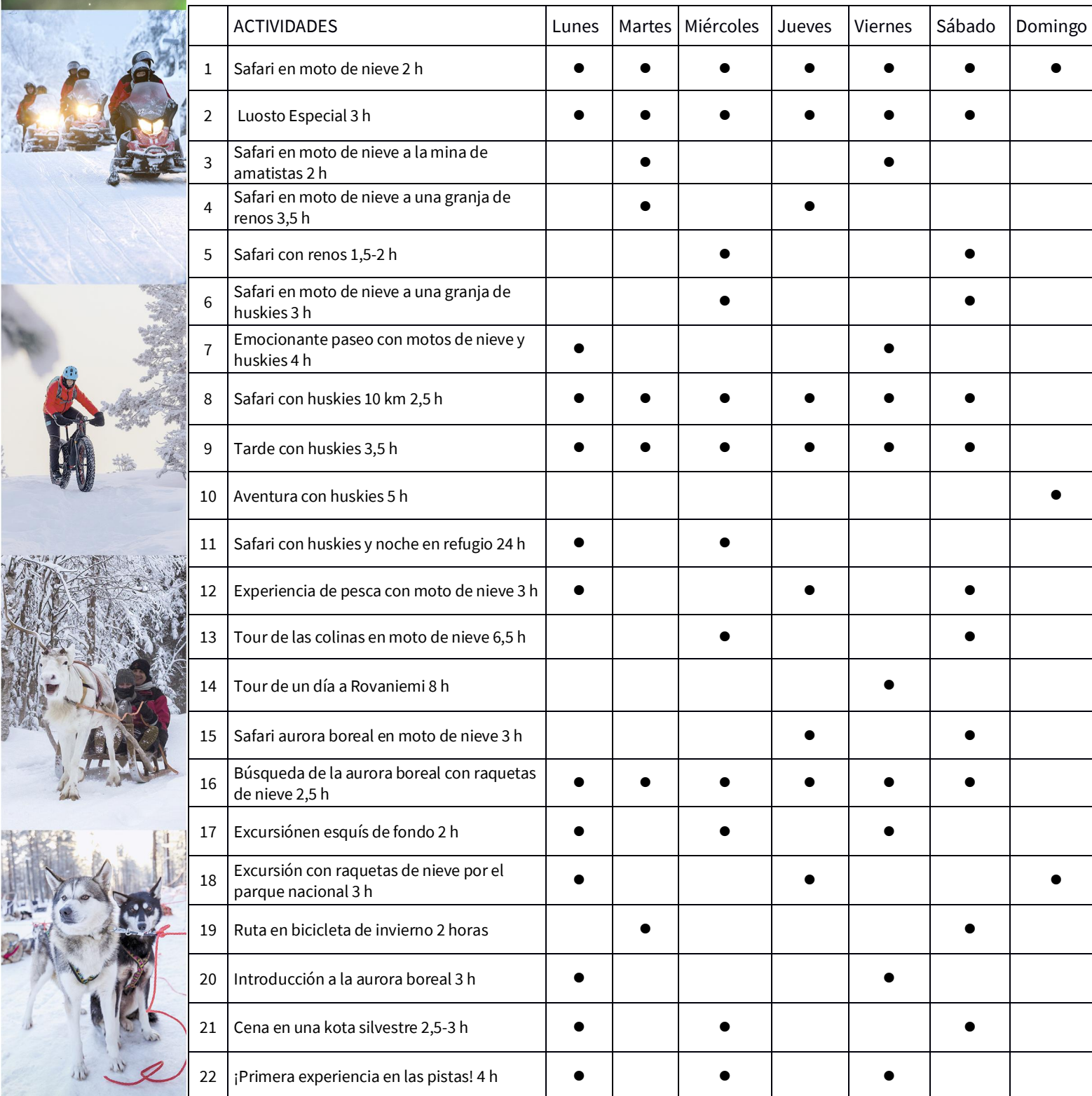
TABLA DE ACTIVIDADES